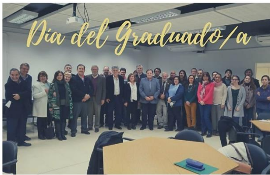
21 DE JUNIO - FCEFYN UNC

Facultad de Ciencias Exactas Físicas y Naturales