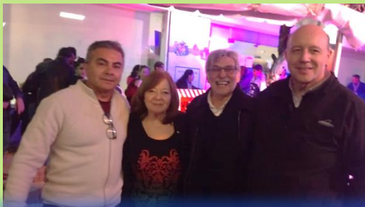
Foto: EL PRESIDENTE DEL CONSEJO REGIONAL INTERIOR: T.C.U EDUARDO CLAUDIO VEGA con las autoridades de la Cooperativa.

en los festejos 56 aniversario DE LA COOPI De Villa Carlos Paz - Gracias por la invitación a nuestro colegio y mención en el evento de nuestro 30 ANIVERSARIO