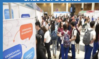
ESTUVIMOS EN LA EXPOCARRERAS