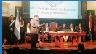
ESTUVIMOS EN LA COLACION DE GRADOS DE LA FCFYN