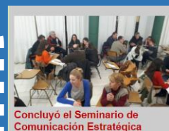
Concluyó el Seminario de Comunicación Estratégica

Solo mediante la participación y el esfuerzo mancomunado, fortaleceremos a nuestra institución. El trabajo participativo con otras entidades mediante foros y comisiones, espacios de discusión nos posiciona y destaca nuestra tarea profesional.