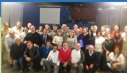
FESTEJAMOS NUESTRO 28° ANIVERSARIO