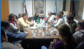
NUESTRA PARTICIPACION EN LA FEPUC