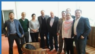
NUESTRA PARTICIPACION EN EL FORO REGION CENTRO VICTORIA ENTRE RIOS