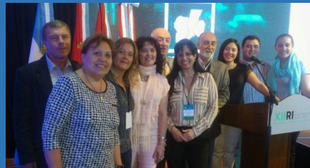
NUESTRA PARTICIPACION EN LA REGION CENTRO