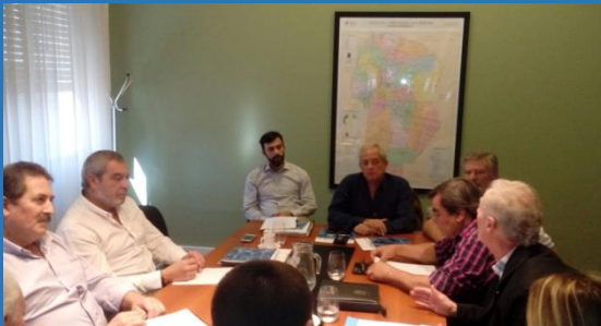
REUNION EN EL MINISTERIO DE INFRAESTRUCTURA PARA FIJAR valor m2