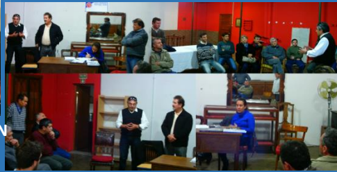
REUNION DE JUNTA DE GOBIERNO EN JESUS MARIA