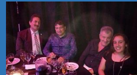
FESTEJAMOS EL DÍA DEL PROFESIONAL UNIVERSITARIO