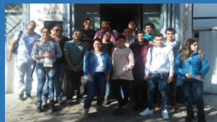
NOS VISITARON ALUMNOS DEL CRES Va. DOLRES