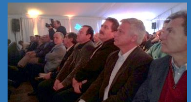
ESTUVIMOS EN JORNADAS Y FOROS FERALCIONADOS A LA CONSTRUCCION