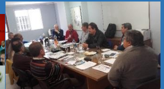
PARTICIPAMOS ACTIVAMENTE EN LA CAJA DE PREVISION PROFESIONAL