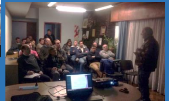
DICTAMOS CURSOS DE ACTUALIZACION PROFESIONAL