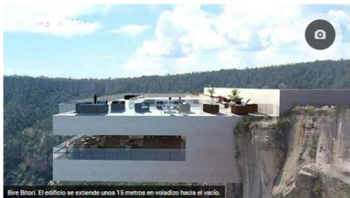
Biré Bitori. El edificio se extiende unos 15 metros en voladizo hacia el vacío.

La propuesta gastronómica de Biré Bitori incluirá platos típicos mexicanos y la experiencia de disfrutarlos en un salón suspendido en el aire.