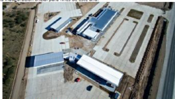
Vista aérea del complejo que LAC construye en Deán Funes

La lleva adelante la empresa LAC y con su puesta en marcha generará 140 nuevos puestos de trabajo, para mano de obra local. Se espera su inauguración oficial para fines de este año.